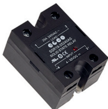
SSR19 - 25/40/60 A