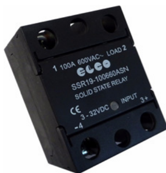
SSR19 - 80/100/125 A