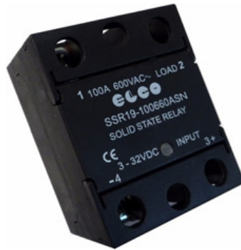
SSR19 - 80/100/125 A