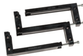
DES 24MX – modulární rámová dělená kabelová průchodka